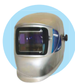
잭슨세이프티* W40 엘리먼트 VARIABLE ADF

용접작업의 필수품, 그리고 생산성 향상 극대화를 위한 잭슨세이프티* 자동용접면