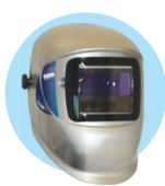
잭슨세이프티* W30 엘리먼트 SH10 ADF