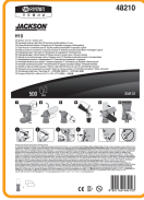
H10 대용량포장 (500개/폴리백)